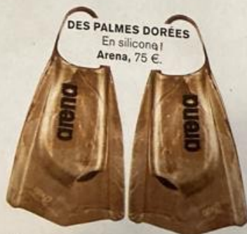
DES PALMES DORÉES En silicone Arena, 75 €.