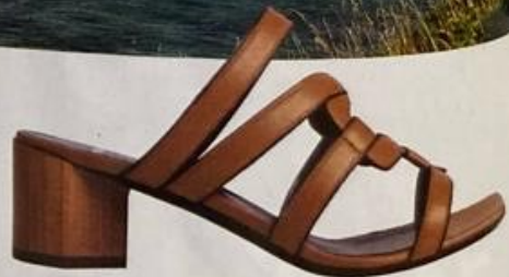
UNE MULE NATURELLE En cuir Pierre Hardy, 725 €.