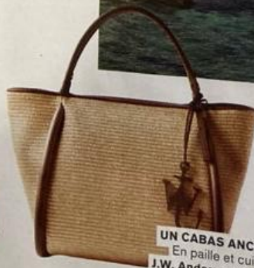
UN CABAS ANCRÉ En paille et cuir J.W. Anderson, 910 €.